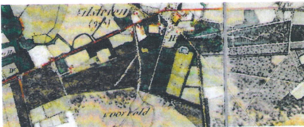
Afb. 5.43 Sterrenbossen met de verlandschappelijking op het Veldminuut 1851. Vilsteren is verdeeld over twee kaartbladen waardoor er een naad door de afbeelding loopt.