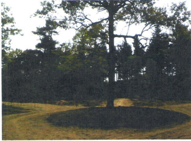
Middelpunt van nieuw aangelegde lanen

De Achterste Steren , een voormalig sterrenbos is weer zichtbaar gemaakt. Delen van het oude sterrenbos die nog terug te vinden waren, zijn in ere hersteld. Sterrenbossen horen bij de zogenaamde Franse landschapsstijl. Begin 19e eeuw raakte dit uit de mode en werd overgegaan op de Engelse landschapsstijl. Hierbij horen juist kronkelende paden, waterpartijen en dergelijke. Bij het herstel is er voor gekozen beide stijlen te combineren. Een deel van de greppels uit de geometrische aanleg is bij de verlandschappelijking vergraven tot een verslingerde vijver. De waterpartij nabij het centrum van het sterrenbos is daarom ook weer in ere hersteld.