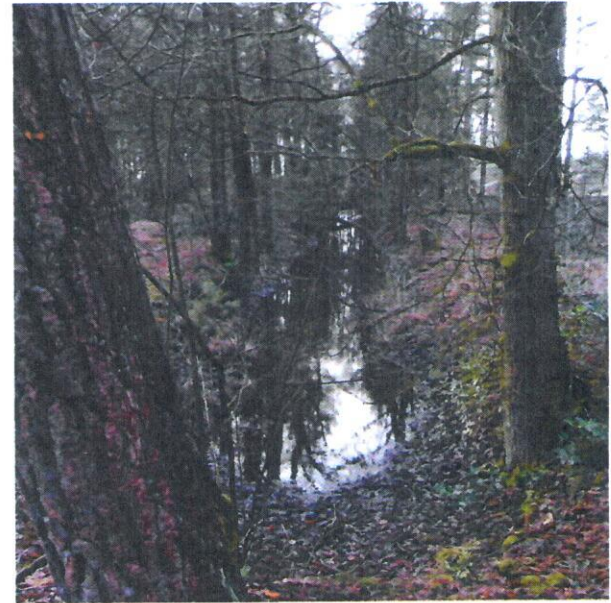
Dichtgeslibde vijver in landschapsstijl

De Achterste Steren , een voormalig sterrenbos is weer zichtbaar gemaakt. Delen van het oude sterrenbos die nog terug te vinden waren, zijn in ere hersteld. Sterrenbossen horen bij de zogenaamde Franse landschapsstijl. Begin 19e eeuw raakte dit uit de mode en werd overgegaan op de Engelse landschapsstijl. Hierbij horen juist kronkelende paden, waterpartijen en dergelijke. Bij het herstel is er voor gekozen beide stijlen te combineren. Een deel van de greppels uit de geometrische aanleg is bij de verlandschappelijking vergraven tot een verslingerde vijver. De waterpartij nabij het centrum van het sterrenbos is daarom ook weer in ere hersteld.