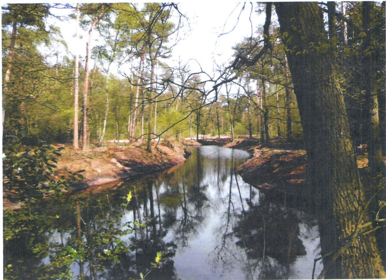
Uitgebaggerde vijver in de nieuwe stijl

Ook wordt gewerkt aan het versterken van de geometrische laanstructuur van de sterrenbossen. De lange zichtlijnen van het sterrenbos moeten de verschillende parkdelen weer met elkaar verbinden. De beplanting van de terreindelen moet op elkaar aansluiten om meer samenhang te creëren. Verder wordt de landschapsstijl versterkt door duidelijke wandelpaden; een rondwandeling is bedoeld om te wandelen van tafereel naar tafereel. De paden moeten doorlopende routes vormen en uitnodigen tot de rondwandeling.